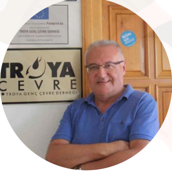
Oral Kaya Koordinatör